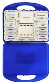
▲エネルギー12本セット