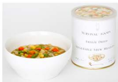
▲サバイバルフーズ（野菜シチュー・クラッカー）