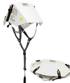
▲折りたたみ式ヘルメット