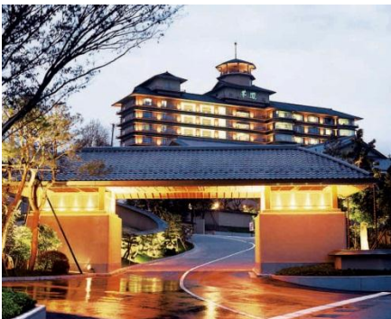
<新潟> 白玉の湯華鳳