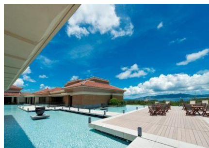
<沖縄> ザ・リッツ・カールトン沖縄