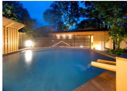
<静岡> ABBA RESORTS IZU-坐漁荘