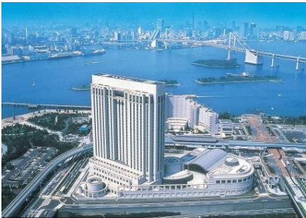
<東京> グランドニッコー東京 台場