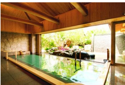
<山口> やまぐち・湯田温泉 古稀庵